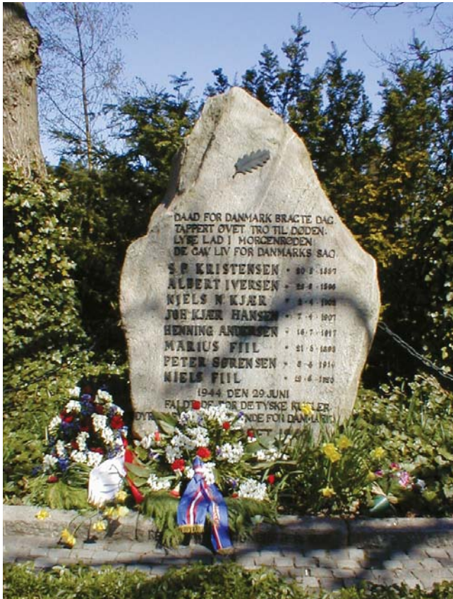
Mindestenen i Hvidsten

Medbragte hunde skal være i snor og turen må ikke foretages i jagtsæsonen.