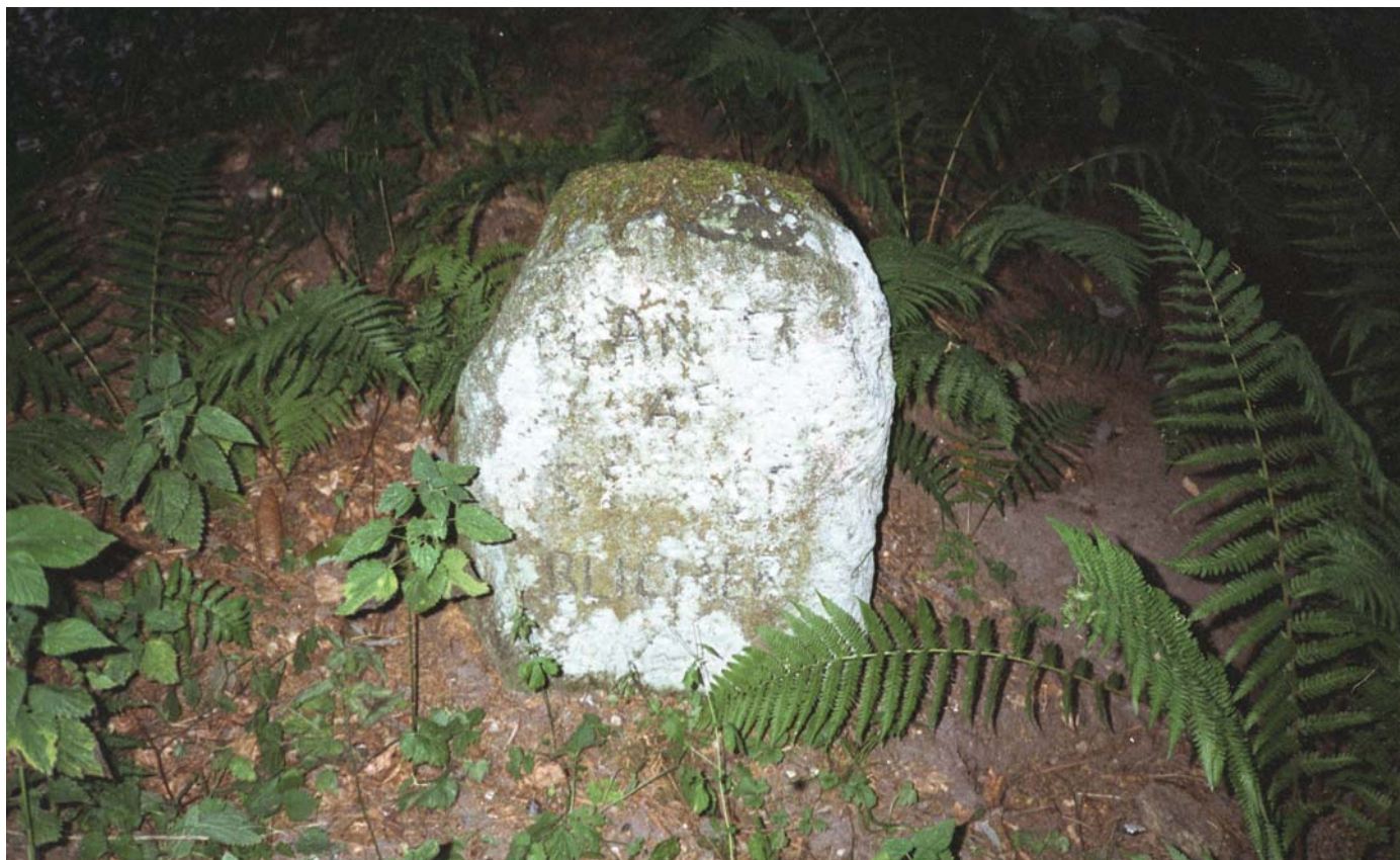
Steen St. Blicher-stenen

Fra 1916 til 1960 var der central i byen, ligeledes var der tidligere både købmand, smedie, tømrer og et lille brødudsalg.